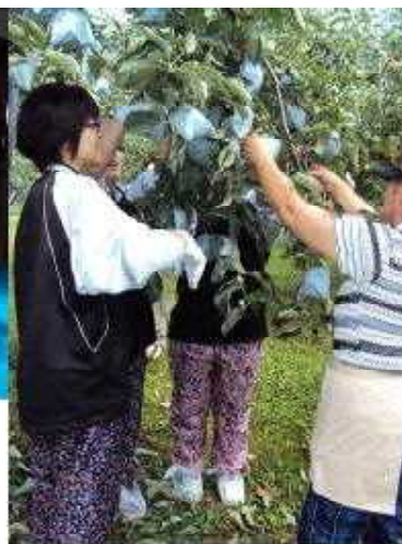
上左 【ごぼう掘り】 上中 【みそ作り】 上右 【りんご葉取り作業】 下左 【トマト収穫作業】 下右 【さくらんぼ収穫】