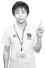
農業委員会事務局 館岡