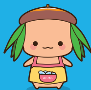
青森中央短期大学 マスコットキャラクター 「ちゅっぴい」